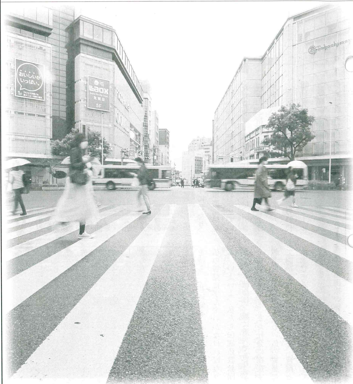
(「コロナ禍 賑わいが消えた京都の街：四条河原町交差点」)