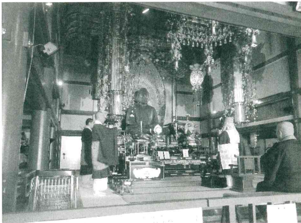
【立誠仏教団による法要の様子】

のもと法要が勤められ、世界的な感染拡 大をみせる感染症の早期終息を念じると 共に、感染症により命を落とされた多く の方々とそのご家族、罹患され現在も治 療に励まれているの方々へ思いを馳せた。 京都府仏教連合会からは、三神栄法事 務総長が当会を代表しての灌仏を行った。