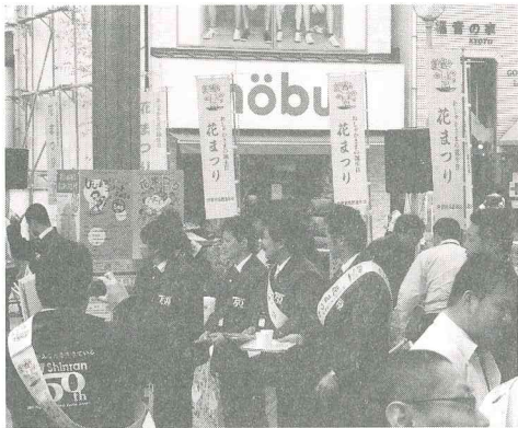
商店街でのPR活動の様子

併せて、誓願寺前の新京極通りでは、加盟本山の職員がアナウンスによる花まつりの説明を行うとともに、商店街を行き交う人々に甘茶や花の種を配布し、積極的に花まつりのPR活動を行った。また、昨年同様加盟各宗派からのマスケットキャラクターにも参加いただき、会場周辺は多くの家族連れで賑わっていた。